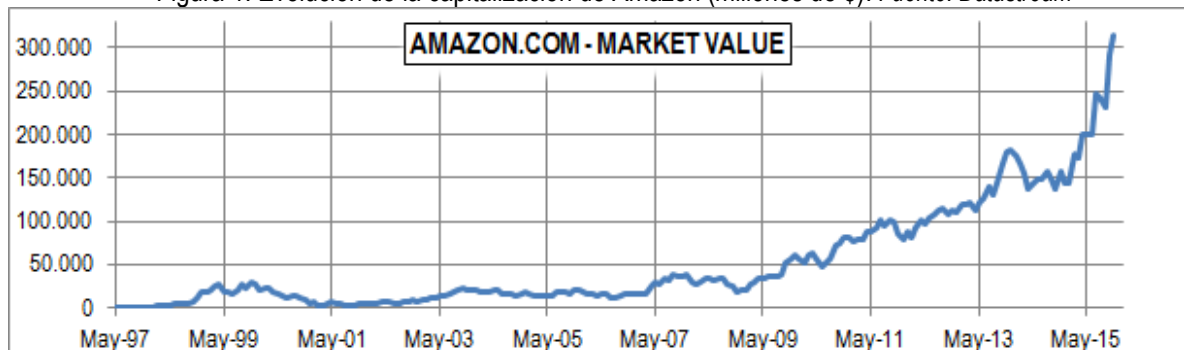
Figura 1. Evolución de la capitalización de Amazon (millones de $).